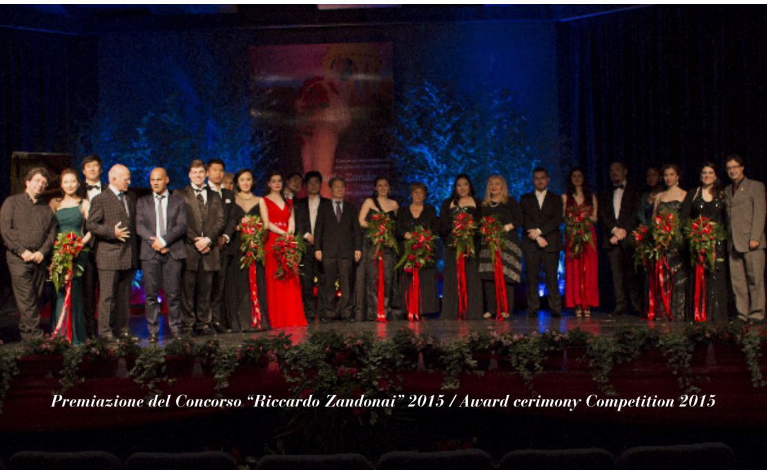
Premiazione del Concorso "Riccardo Zandonai" 2015 / Award ceremony Competition 2015

No travel or accommodation expenses will be reimbursed to competitors by the organisation. Bed and breakfast accommodation at the Casa della Gioventù (Youth Hostel) in Riva del Garda is provided, for a limited number of places, to those participants who require it, upon written request and receipt of the entry fee and till the successive day to that in which they had to be eliminated or to withdraw themselves. The places will be assigned following the entry order of the applications.