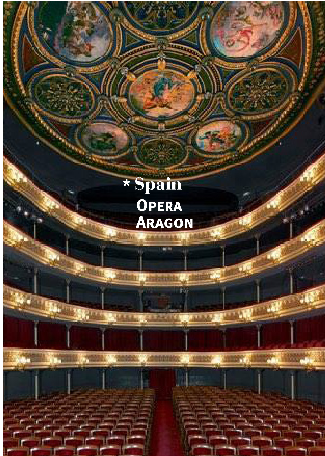
*Spain OPERA ARAGON