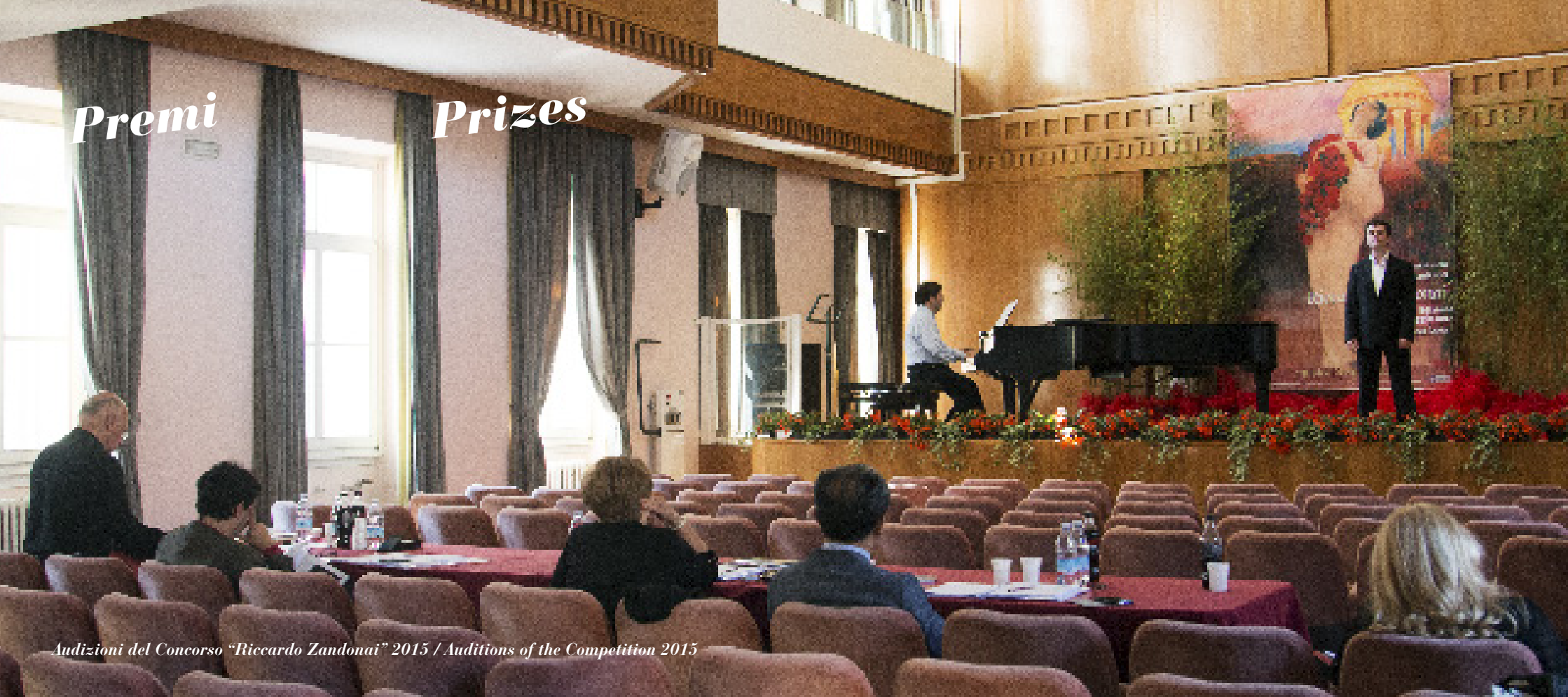
Audizioni del Concorso "Riccardo Zandonai" 2015 / Auditions of the Competition 2015