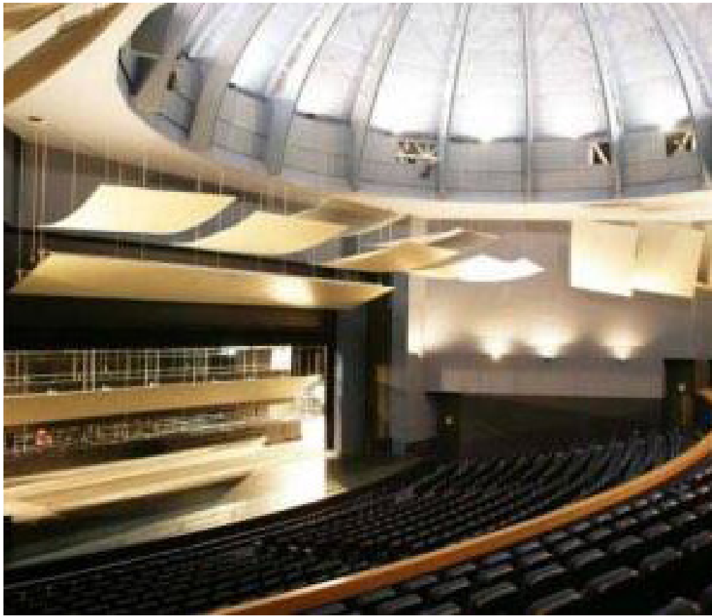
*Spain COMUNIDAD VALENCIANA