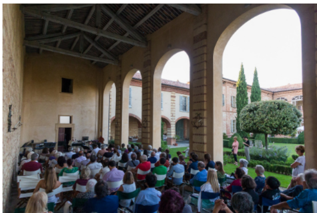
Concerto a Grazzano Badoglio - 2023