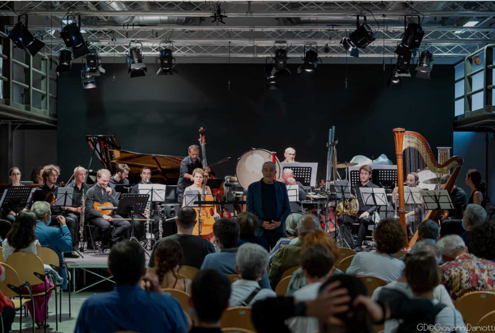
Concerto a Milano, Sala Donatoni, Fabbrica del Vapore - 2023