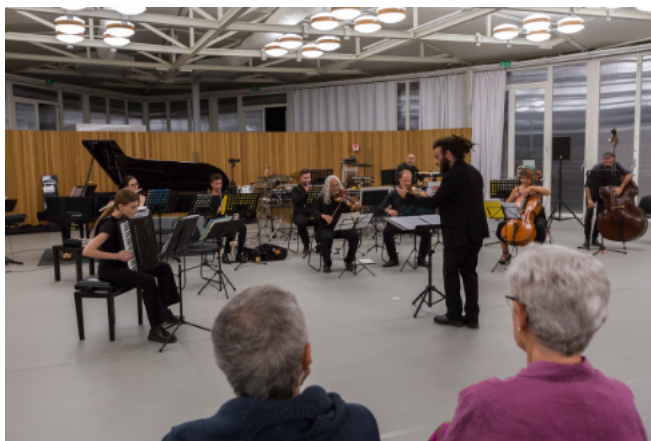
Urquiza, Tiramisu - 2023

Progetto a cura di Divertimento Ensemble Direttore artistico Sandro Gorli