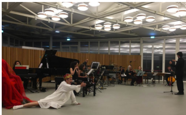
Maxwell Davies, Eight Songs for a Mad King - 2022

Il miglior allievo viene invitato a dirigere un concerto a Milano nella stagione Rondò 2025.