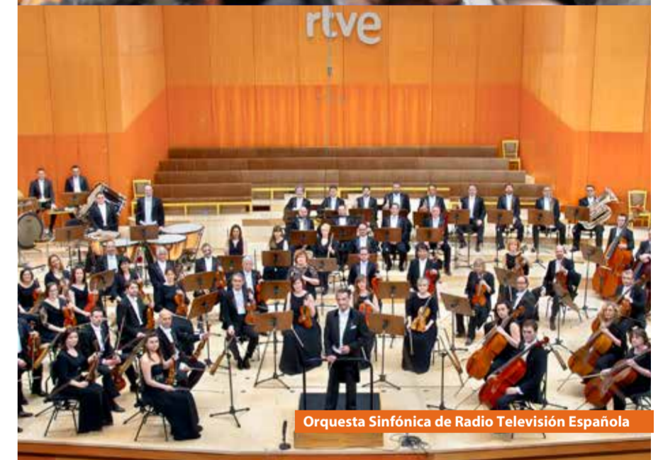
Orquesta Sinfónica de Radio Televisión Española